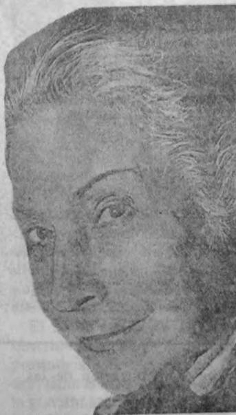
Margarita Xirgú nació el 18 de julio de 1888 en Molins del Rey, España. Casada dos veces, no tuvo hijos. Vivió exiliada en América desde 1936.

pasamanería. Su precoz vocación artística, la convierte poco a poco en "la nostra Margarida" como le decían con cariño los diarios barceloneses al dedicarse por entero y profesionalmente al teatro en 1906. En su carrera supo siempre afrontar los riesgos artísticos o comerciales que podían venir de su constante in-